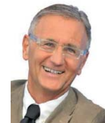
André Vallini Président du Conseil général de l'Isère